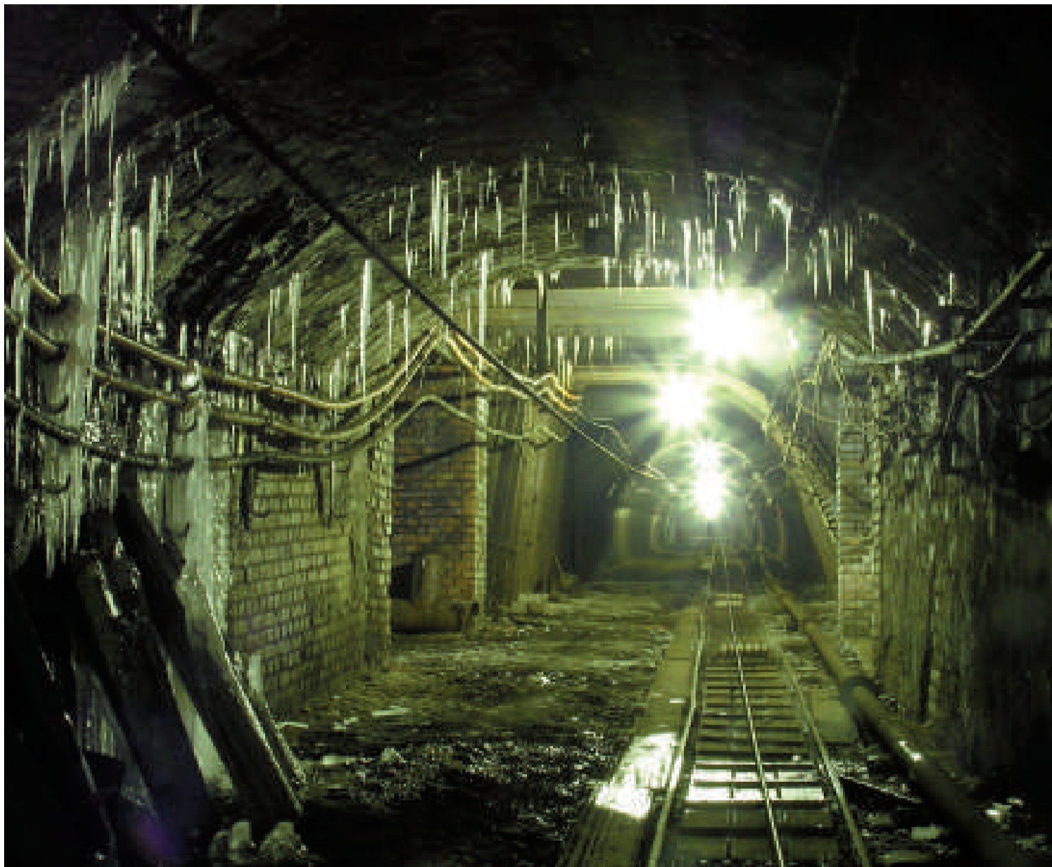
Letošní mírná zima působila v dolech problémy hlavně povrchové kolejové dopravě. Na snímku ledová výzdoba v jedné ze štol dolu Marie v Královském Poříčí.