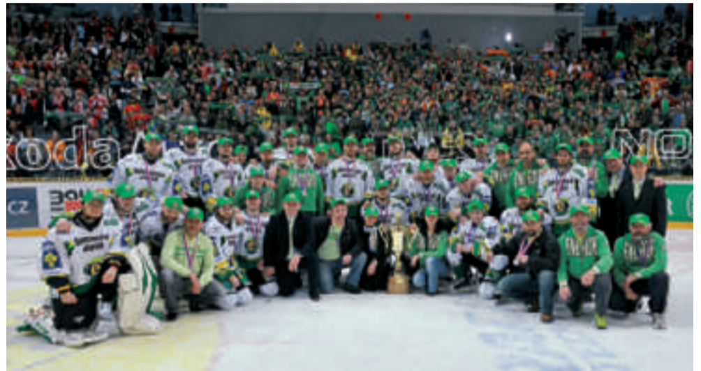
Stříbrný tým extraligy 2007–2008 HC Energie Karlovy Vary v O2 aréně před svými fantastickými fanoušky

„V první chvíli, když jsme se Slávií prohráli a přišli tak o titul, jsem já osobně byl hodně zklamaný. Ale pak si s odstupem pár hodin člověk uvědomí, že to vlastně byl obrovský úspěch," říká kapitán týmu. Ve dvou větách tak shrnuje vše, co v uplynulých týdnech karlovarští fanoušci zažili. Sezónu, která se navždy zapíše do historie zdejšího sportu.