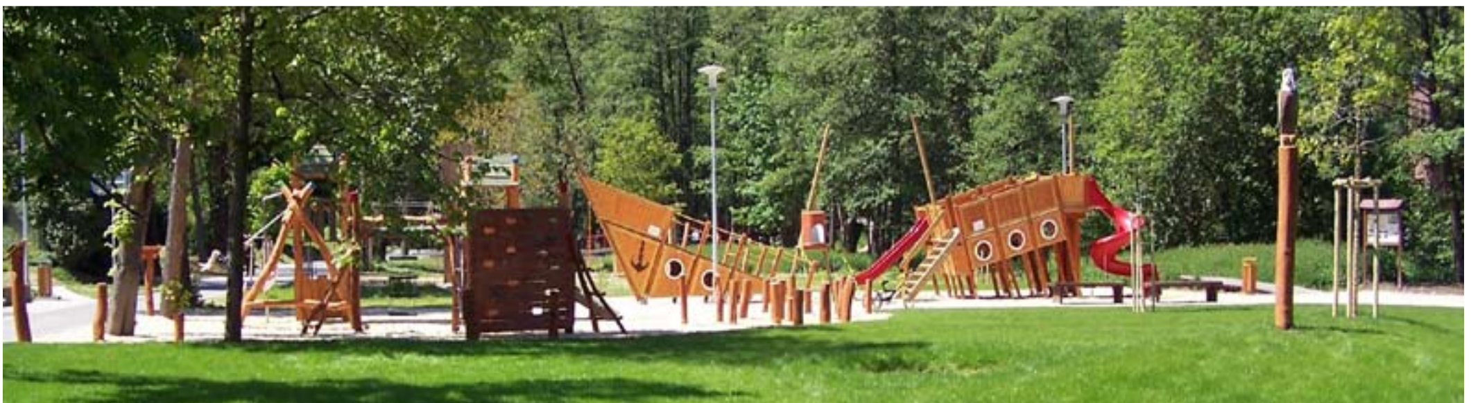
► Firma ale neumí zdaleka jen stavět parky. K jejím doménám patří také dětská hřiště, nebo zahrady u rodinných domků