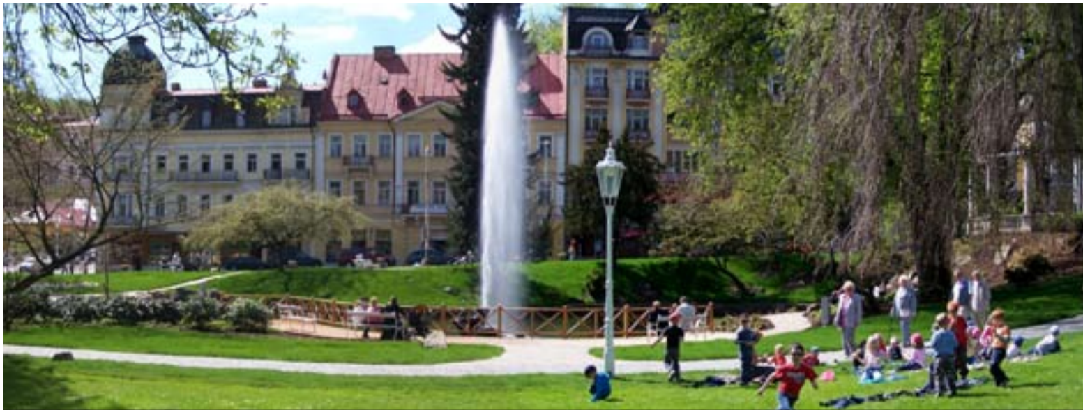
► Zahradní a parková je podepsána také pod úpravou nebo údržbou řady ploch veřejné zeleně v lázeňských městech regionu

„Za těch několik let se nám podařilo vybudovat skutečně špičkový tým lidí, a to nám navíc umožňuje i přemýšlet o dalším rozvoji,“ dodává Poc s tím, že v budoucnosti by se firma chtěla zaměřit, vedle dalšího rozšiřování výstavby parků a revitalizace území poškozených průmyslovou činností, také na další rozvoj své projekční činnosti.