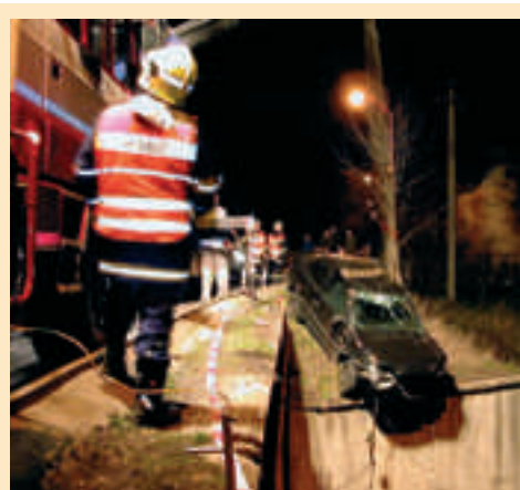
Kuriózní nehodu museli před časem řešit zaměstnanci společnosti Sokolovská uhelná ve Vintřově. Řidič Fordu Escort si tam totiž do slova skočil z deset metrů vysokého mostu na koleje. K jeho velkému štěstí pád zbrzdily troleje a řidiči se tak téměř nic nestalo. Svým kaskadérským kouskem ale výrazně přídělal práci zaměstnancům Sokolovské uhelné. Nejen, že zaměstnal firemní trolejáře, ale na několik hodin dokonce zcela vyřadil z provozu nakládku lomů Družba i Jiří.

V okolí budoucího jezera pak mají vyrůst desítky zajímavých lokalit, od těch sloužících k rekreaci, až po území specifické zástavby. (red)