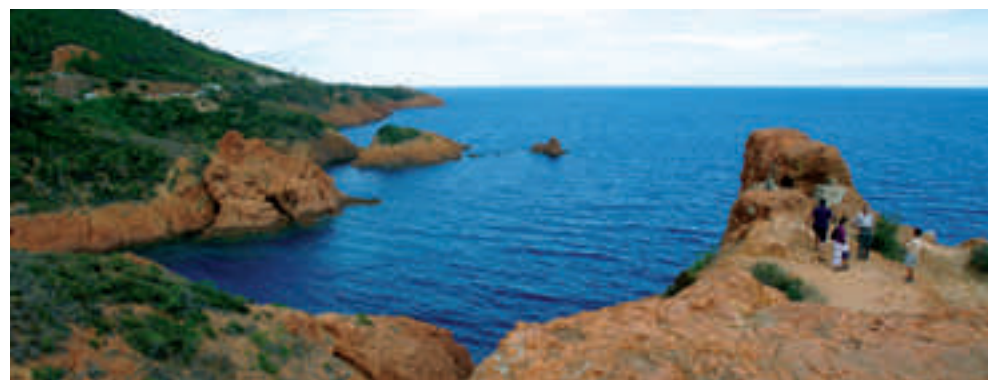
Prostředky ze sociálního fondu mohou zaměstnanci společnosti použít i na úhradu dovolené