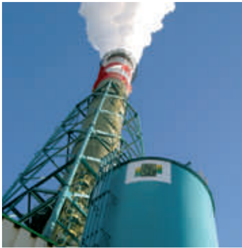
Stávající odsíření teplárny ve Vřesové čeká ještě letos intenzifikace

Z tohoto důvodu bude část technologie v místě instalována již s předstihem. Kromě klasické odstávky pak stavba využije i souběžně probíhající plánovanou rekonstrukci jednoho z bloků paroplynové elektrárny. „Rekonstrukce