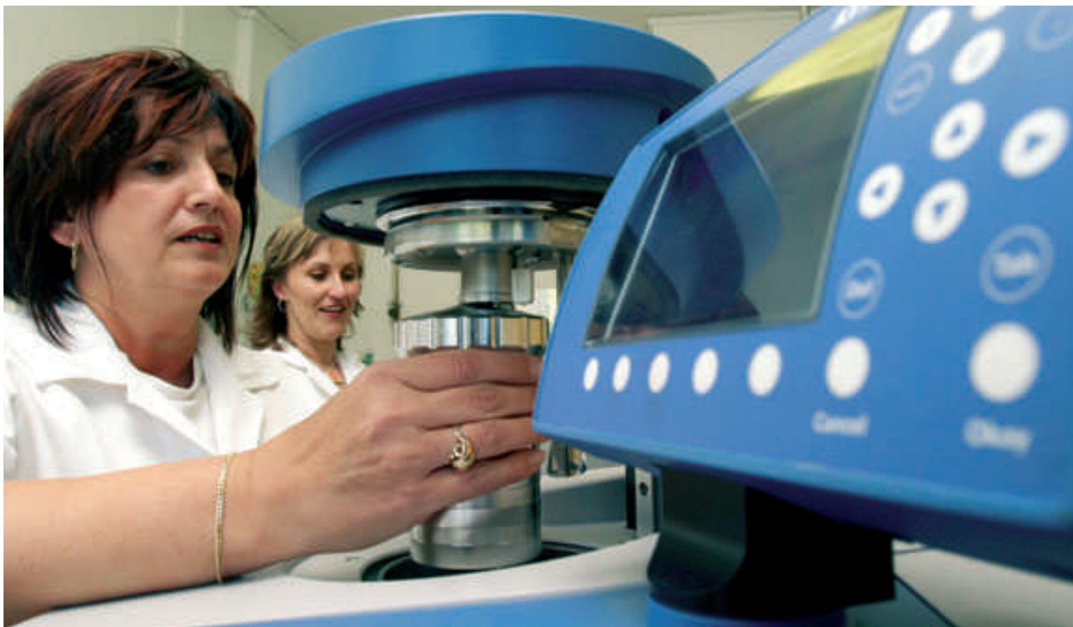
Parametry uhlí, které směřuje z lomů Sokolovské uhelné do zpracovatelské části ve Vřesové, patří k nejsledovanějším kritériím výroby vūbec. Hrají totiž zásadní roli při zajištění efektivního provozu ekologických technologií. Jednou z nich je i právě realizovaná intenzifikace odsíření teplárny. Více o připravované investici na straně 3. Na snímku pracovnice firemních laboratoří při měření spalného tepla v uhlí a kapalných palivech.