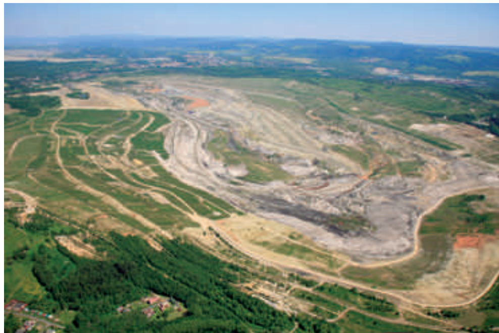
Letecký pohled na lom Medard-Libík od Lítova. V pozadí východní část budoucího jezera, ke které povede nový obchvat

Kromě západního obchvatu Sokolova by napouštění Medardu s sebou mělo přinést také investice do stávající silnice mezi Svatavou i Habartovem. Kolem samotného jezera pak postupem času vzniknou další kilometry zcela nových přístupových a obslužných komunikací. (red)