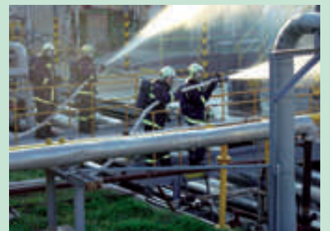
Hasiči zasahují u simulovaného požáru tanku s benzínem

Během náročného cvičení bylo nutno zkoordinovat celkem sedm jednotek hasičů, včetně té firemní ze Sokolovské uhelné. Kromě ní vyjeli hasit na Vřesovou také jednotky ze Sokolova, Chodova, Nejdku, Oloví, Nové Role a Rotavy. Kvůli žáru a zplodinám se pak zasahovalo ve speciálních oblecích a dýchací technice.