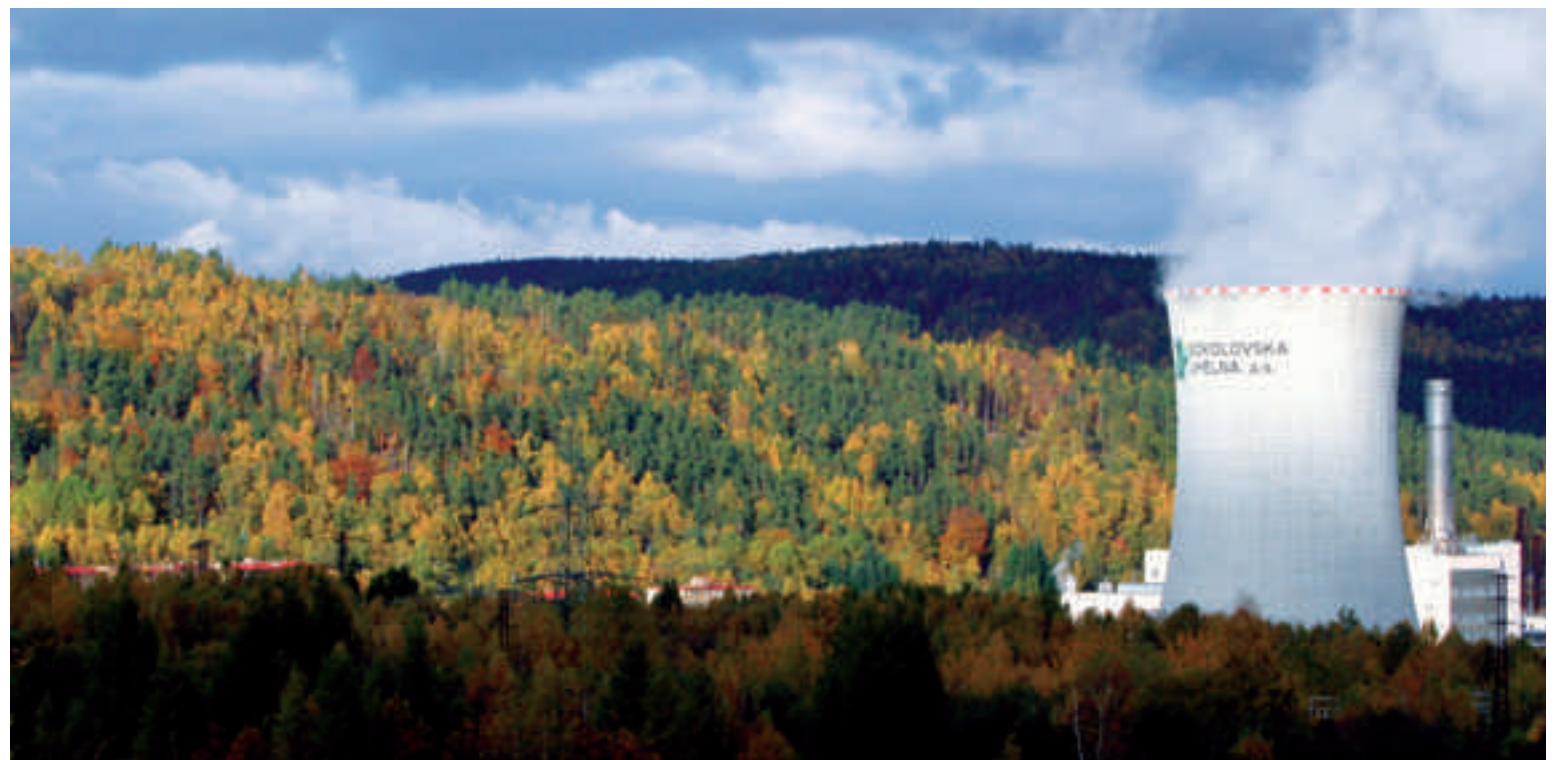
Pouze čistá vodní pára stoupá k obloze z chladicí věže paroplynové elektrárny ve Vřesové. Ta je jedním z nečistších uhelných energetických zdrojů v České republice

Významné zvýšení kvality ovzduší i povrchových nebo odpadních vod. Takové jsou nejviditelnější dopady miliardových investic, které vynaložila na ekologii od roku 1994 společnost Sokolovská uhelná (SU).