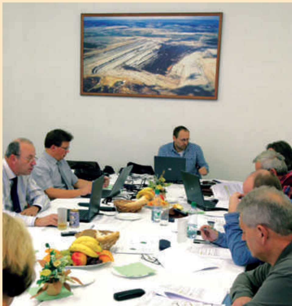
V plném proudu jsou v těchto dnech jednání o nové kolektivní smlouvě pro rok 2008 mezi společností Sokolovská uhelná a zástupci odborových organizací. Na snímku členové vyjednávacích týmů při zasedání ve Vintířově.