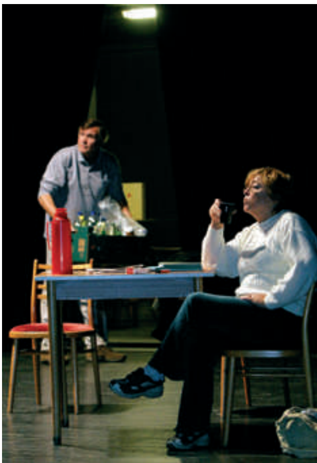
Zkoušky nové hry jdou do finise