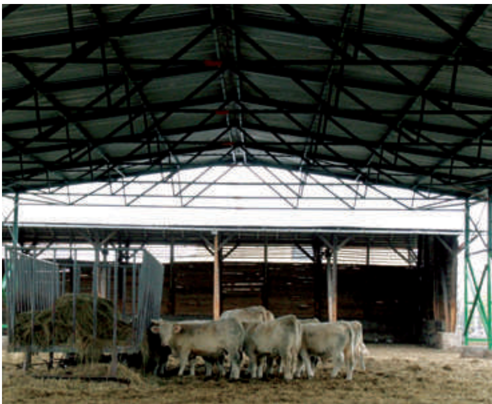
Nové zimoviště krav ve Starém Sedle

Stáda bílých krav masného plemene charolais patří ke koloritu rekultivovaných ploch na Sokolovsku již od roku 1995, kdy do regionu dorazilo první stádo z Francie. V současné době dosahuje velikosti kolem tří stovek kusů. Významnou měrou pak stádo přispívá k obnově krajiny v oblastech bývalých výsypek v okolí Lítova, Lokte, Starého Sedla a dalších míst. (red)