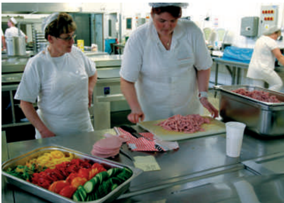
Centrální kuchyně společnosti ve Vintířově